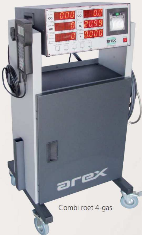
Combi roet 4-gas

Integratie in teststraatconcept mogelijk met PC-gestuurde emissietester.